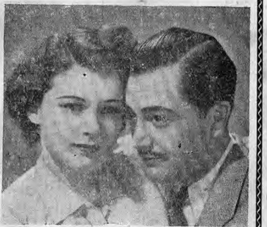
El era un escritor que escribía para las damas, fingiéndose soltero! Y las damas lo adoraban porque creían que era un partido! Y la mujer se podría los hígados de cólera!